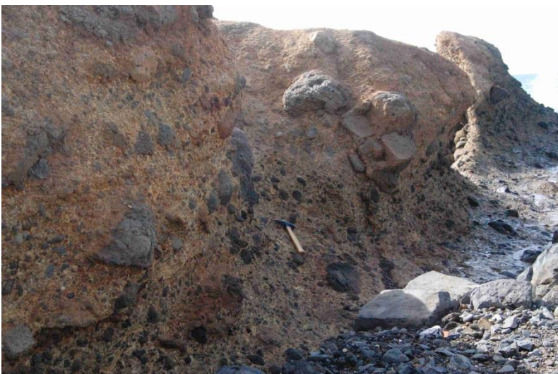
Coulée pyroclastique issue du même cratère, avec observation de blocs transportés de tailles variables.